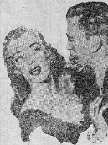
Por Julián Manzaneros.

(Especial para EL GRAN DIARIO LA NACION).