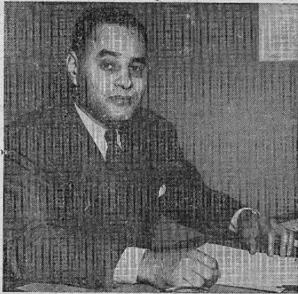
El Dr. Ralph J. Bunche, Mediador Suplente de las Naciones Unidas para Palestina.